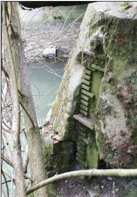
Echelle des eaux et passage capté à Lexat.

Texte et illustrations : Serge Husson, Association Jean-Nicolas Stofflet.