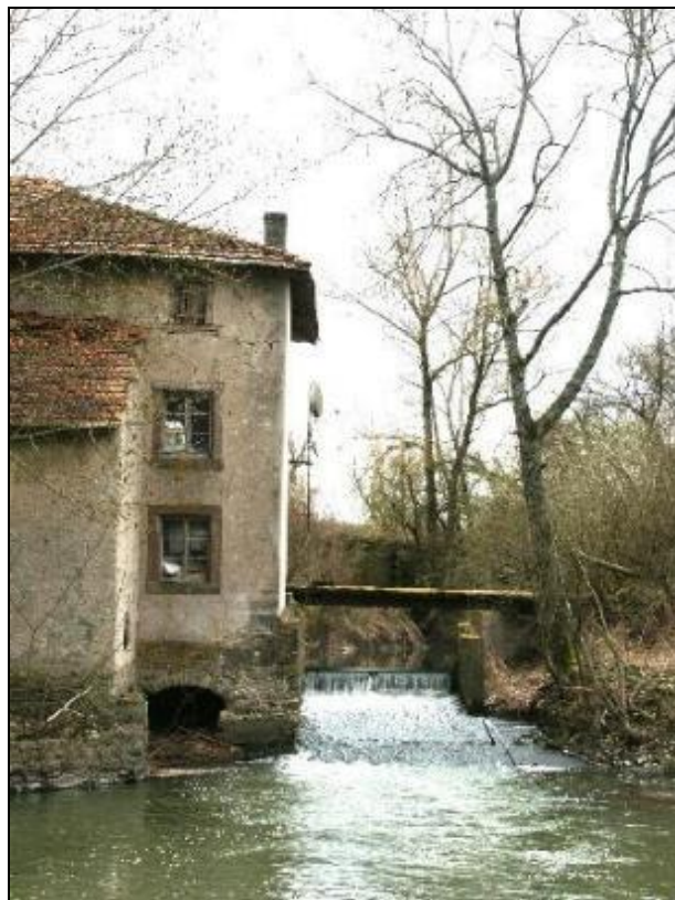
Le moulin de Xures et celui du gué de Lexat aujourd'hui