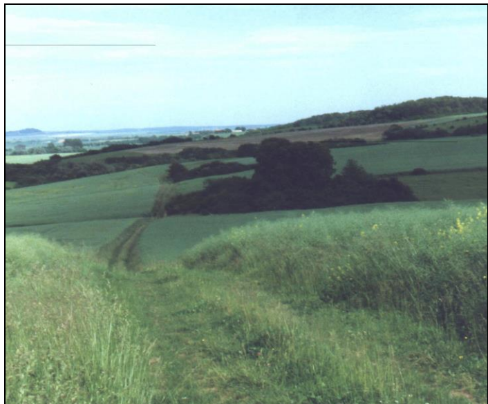
Vue du site, prise du Sud-Ouest.

Ses ruines se dissimulent dans un taillis de plusieurs dizaines de mètres, situé à 1500 mètres du village, à l'extrémité d'un vallon se terminant en une cuvette adossée aux collines de Réchicourt-la-Petite et Coincourt.