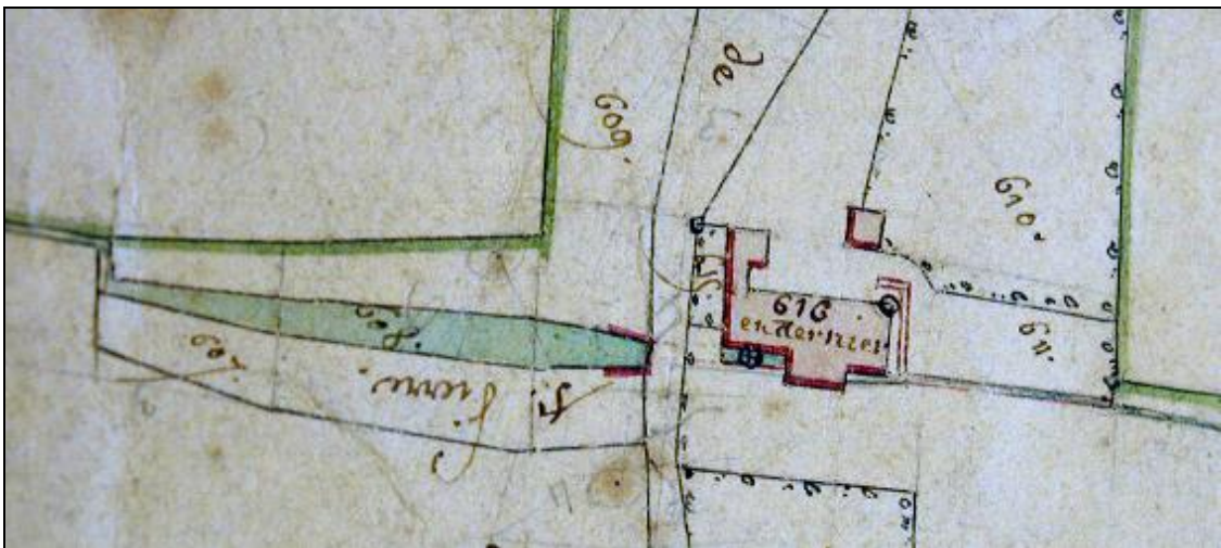
On peut voir la retenue d'eau, le pont qui enjambe le ruisseau et la roue (1828).

Le débit de la fontaine Saint-Pierre a dû toujours être important, puisqu'on trouvait un moulin installé à cinq cents mètres de là (disparu depuis).