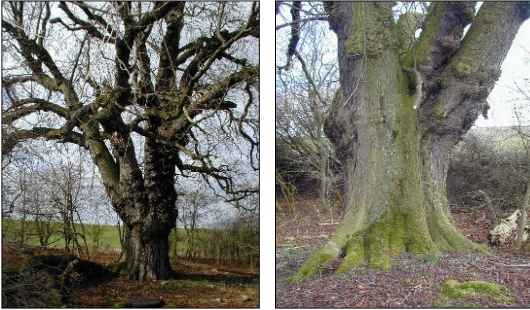
Le marronnier en mars 2000.

Le débit de la fontaine Saint-Pierre a dû toujours être important, puisqu'on trouvait un moulin installé à cinq cents mètres de là (disparu depuis).