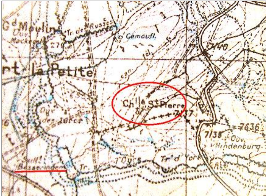
Carte militaire de 1918, avec la chapelle et le saillant Besseringen.

Plutôt qu'un regain de foi, il faut voir dans cette construction-reconstruction une réaction à l'annexion de 1871; le canton de Vic est démembré, une partie devient allemande et l'autre reste française (nouveau canton d'Arracourt). Bezange-la-petite (Klein Bessingen) se retrouve dans la partie allemande et le vallon de la fontaine Saint Pierre est comme un coin qui s'enfonce en territoire français. La chapelle Saint-Pierre est un signal, situé à peine à cinquante mètres de la frontière.