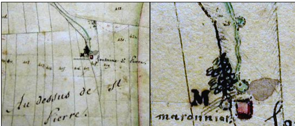
Cadastre de 1828.

Le cadastre napoléonien (1828) apporte des informations complémentaires : il existait bien un édifice antérieurement à la chapelle de 1880. Avec leur précision habituelle, les géomètres de l'époque mentionnent un bâtiment détruit (rectangle entouré d'un liseré noir irrégulier).