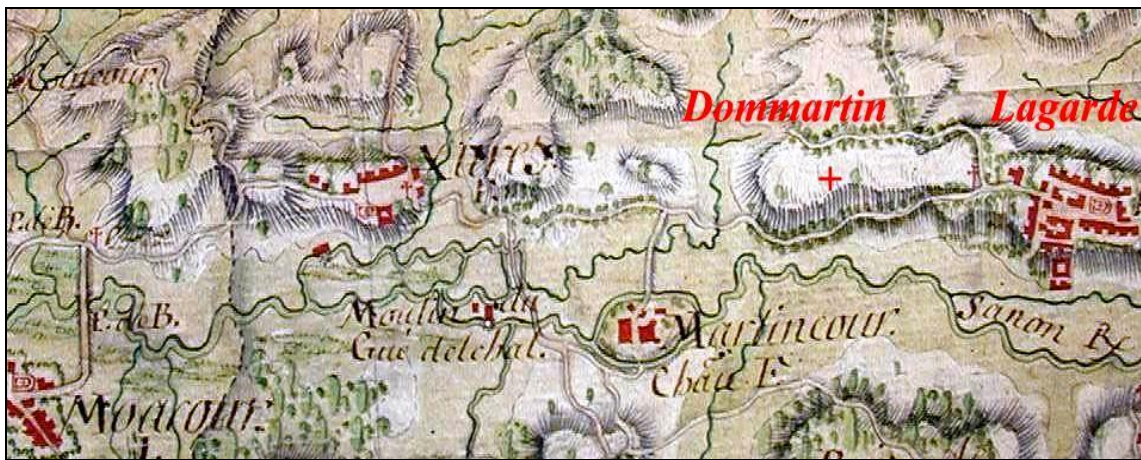
La région de Mouacourt à Lagarde. Carte de la première moitié du XVIII e s. A.D. 57.