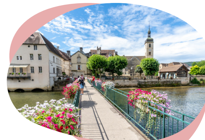
Ornans - Doubs