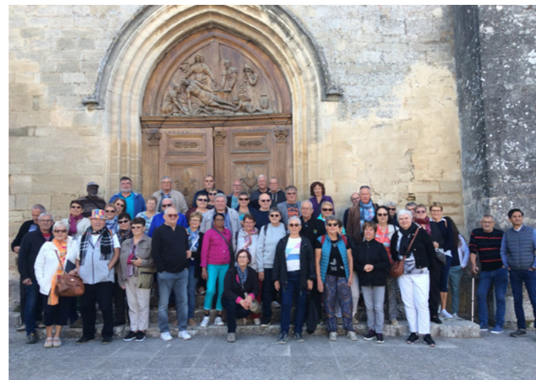
Voyage séniors - Octobre 2022 dans le Luberon

La Communauté de Communes du Pays du Sânon proposera en 2023 des conférences sur diverses thématiques animées par l'association des consommateurs CLCV et par l'Association de Santé, d'éducation et de Prévention sur les Territoires de Lorraine - l'ASEPT Lorraine.