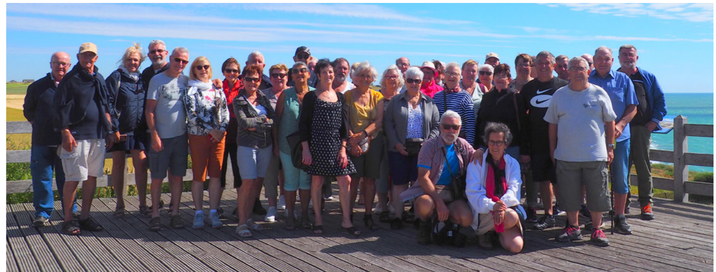
Voyage séniors - Juillet 2022 dans le Pas-de-Calais

Des voyages riches en découvertes culturelles, gastronomiques mais surtout humaines.